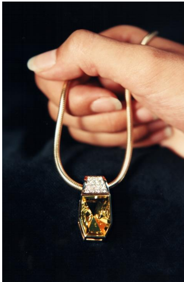
Damenmodel mit Schlangenkette und Hänger